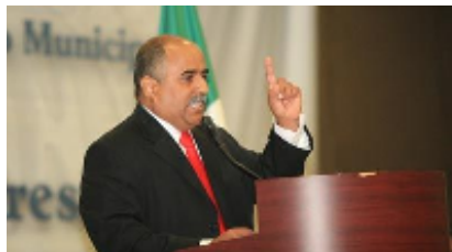
Consideró que no se ha desarrollado eficientemente la tarea.